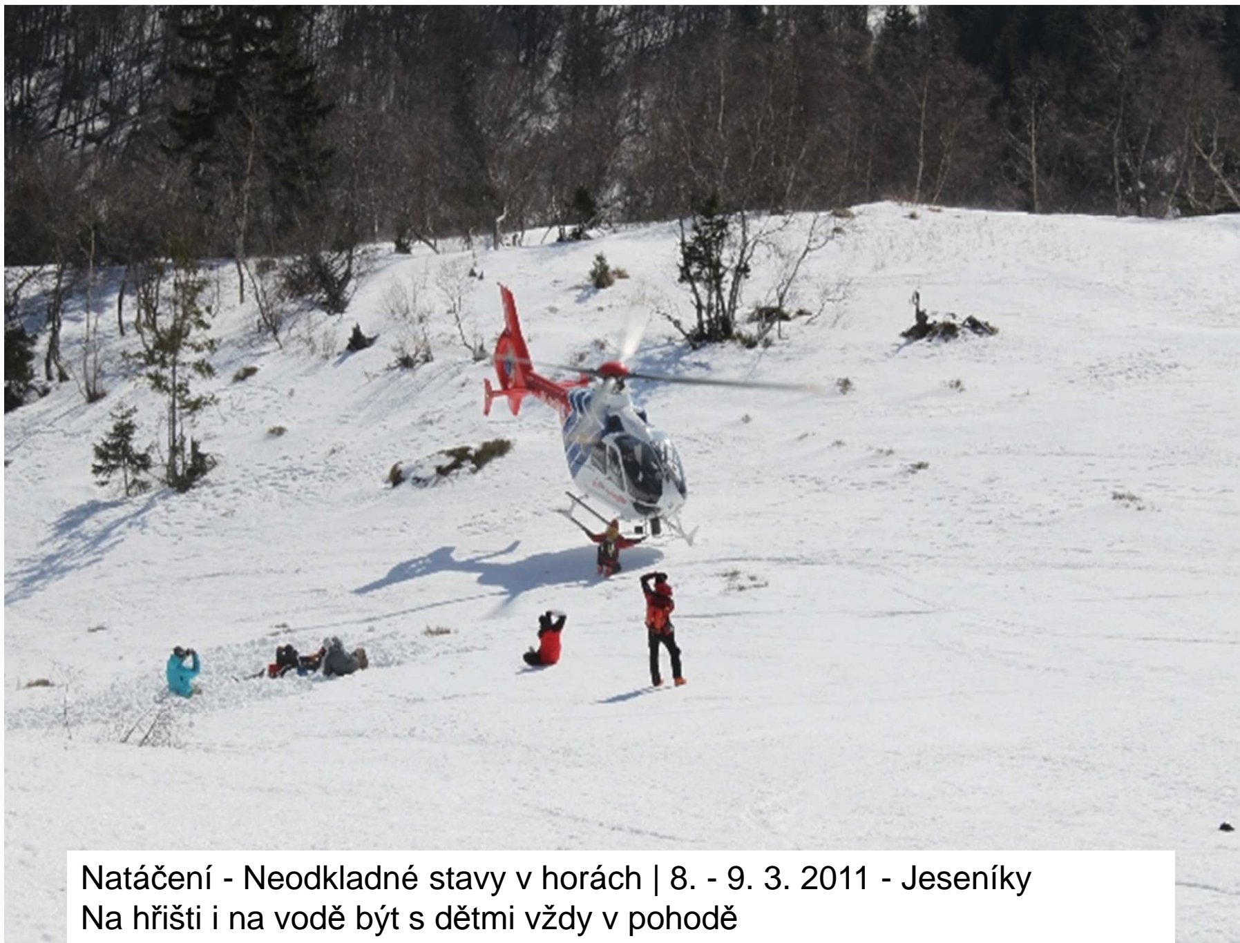
Natáčení - Neodkladné stavy v horách | 8. - 9. 3. 2011 - Jeseníky Na hřišti i na vodě být s dětmi vždy v pohodě