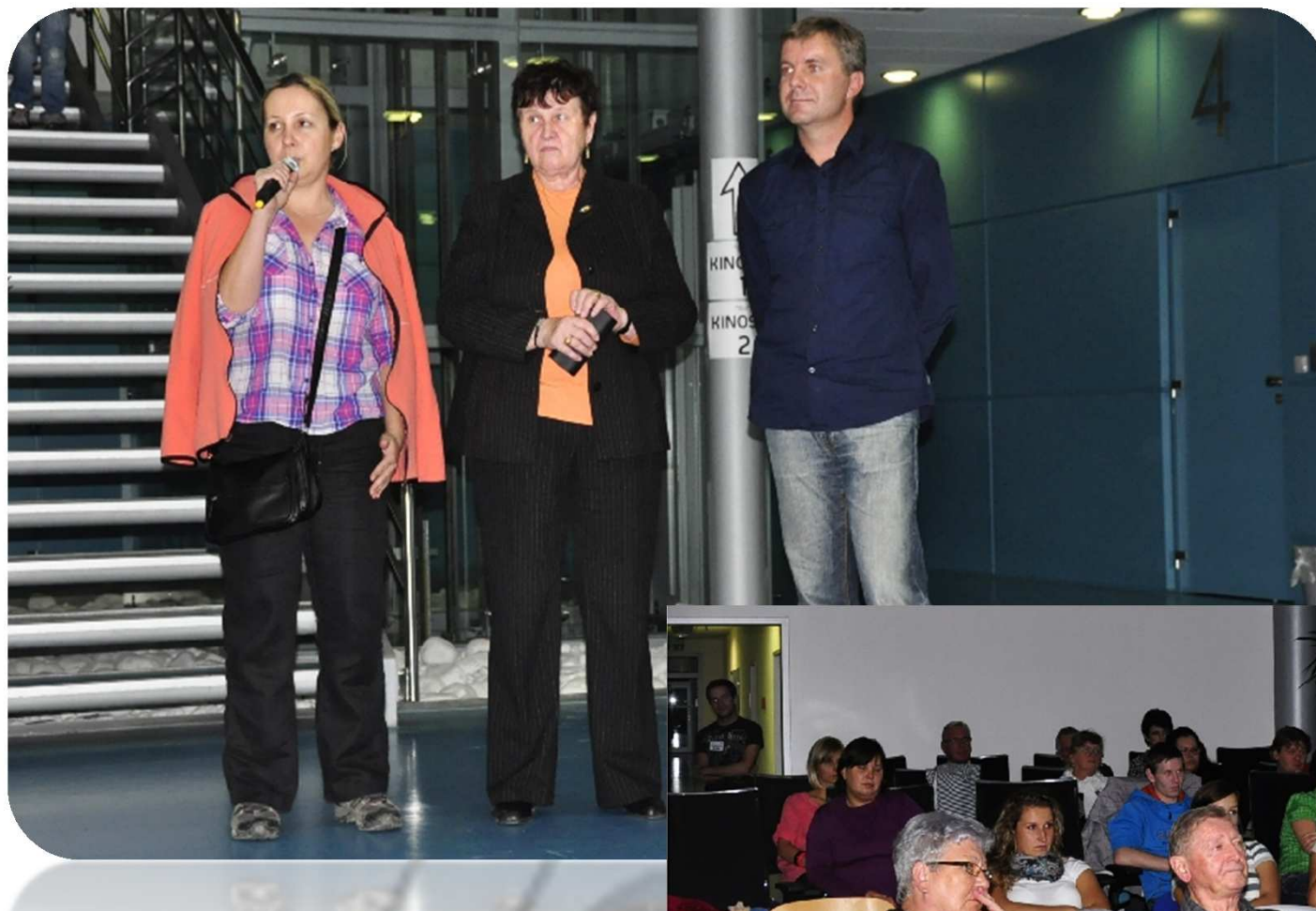
Filmová noc FSpS | 12.10. 2011, foto z webových stránek projektu