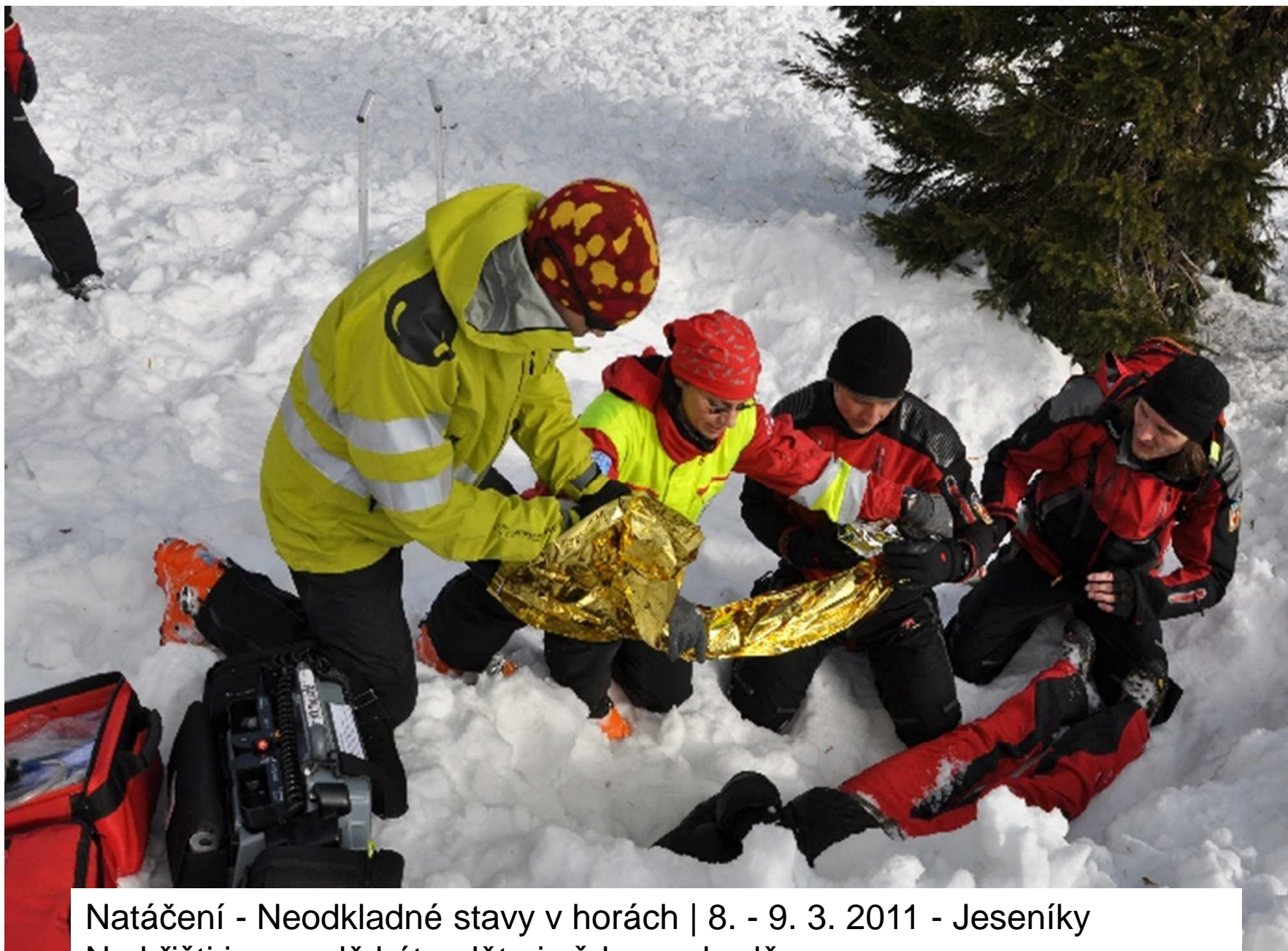
Natáčení - Neodkladné stavy v horách | 8. - 9. 3. 2011 - Jeseníky Na hřišti i na vodě být s dětmi vždy v pohodě