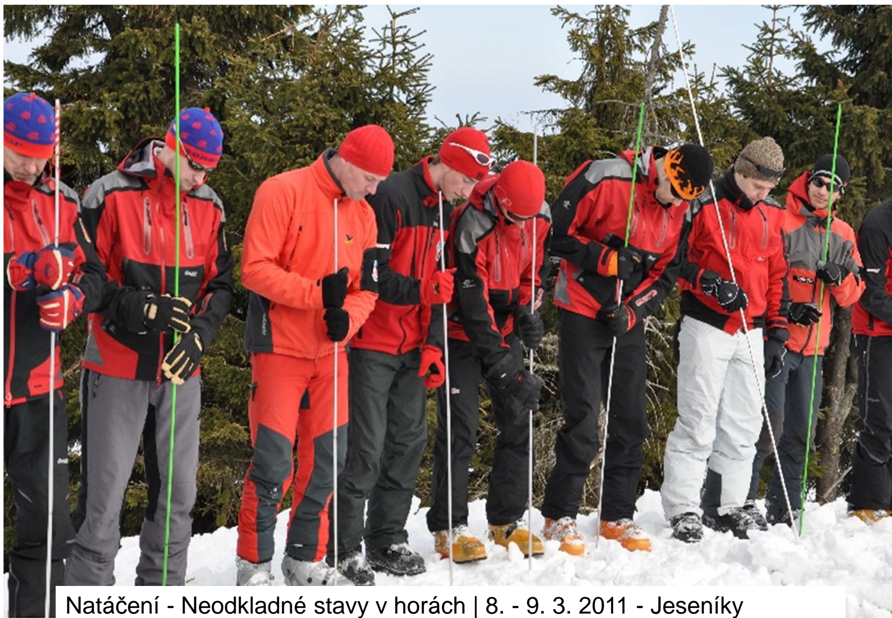
Natáčení - Neodkladné stavy v horách | 8. - 9. 3. 2011 - Jeseníky Na hřišti i na vodě být s dětmi vždy v pohodě